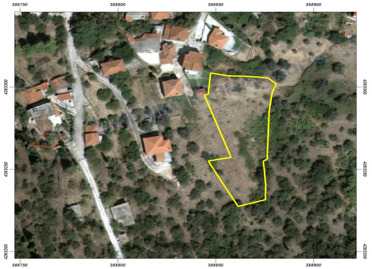
Θέαση ιδιοκτησίας Μαρίας Ιερεμία