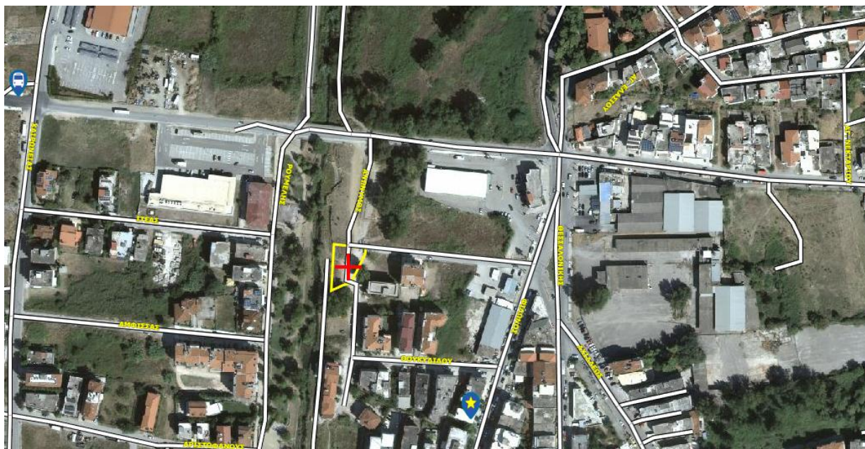
Θέαση Εθνικού Κτηματολογίου