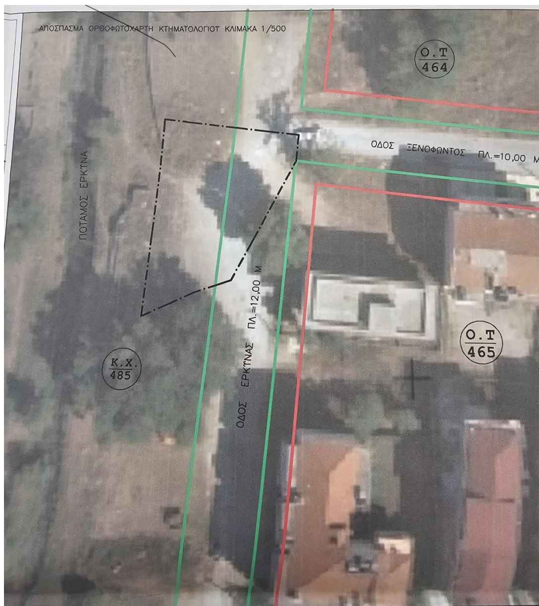
Εντοπισμένη η θέση της ιδιοκτησία Αρ. Αγραφιωτη

Κατόπιν των παραπάνω και επειδή παρήλθε χρονικό διάστημα 52 ετών στο εν λόγω ακίνητο δεν συντελέστηκε η απαλλοτρίωση οπότε και η ενδιαφερόμενη με αίτησή της ξεκίνησε τις νόμιμες διαδικασίες συντέλεσης της. Για το σκοπό αυτό εκδόθηκε η 1/2015 πράξη αναλογισμού, με την οποία ρυθμίστηκαν οι υποχρεώσεις αποζημίωσης τόσο του Δήμου μας όσο και των παρόδιων τρίτων προς τους δικαιούχους ιδιοκτήτες των ρυμοτομούμενων οικοπέδων τους που έχουν καθοριστεί από το εγκεκριμένο ρυμοτομικό σχέδιο ως αμιγώς κοινόχρηστοι χώροι μεταξύ αυτών και η ιδιοκτησία της ενδιαφερόμενης. Η τελευταία πράξη κυρώθηκε με την υπ' αριθμ. 2526/8-09-2015 Απόφαση του Αντιπεριφερειάρχη Στ. Ελλάδας κατά της οποίας δεν ασκήθηκε ουδεμία ένσταση εντός του εύλογου εκ του νόμου χρονικού διαστήματος των 15 ημερών οπότε και εκδόθηκε η υπ' αριθμ. Οικ1437/4-11-2015 βεβαίωση τελεσιδικίας. Στη συνέχεια η διαδικασία συντέλεσης της εν λόγω πράξης συνεχίστηκε με την προσωρινή απόφαση καθορισμού της αποζημίωσης, η οποία εκδόθηκε από το Μονομελές Εφετείο Λαμίας και ήταν η 25/2018 απόφαση.