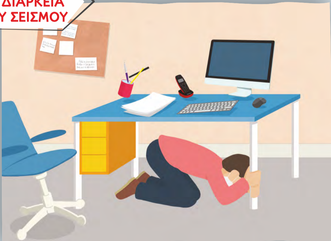
Κάλυψη κάτω από γραφείο κρατώντας το πόδι του