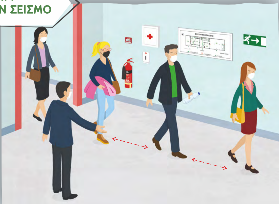
Εκκένωση κτιρίου με ψυχραιμία