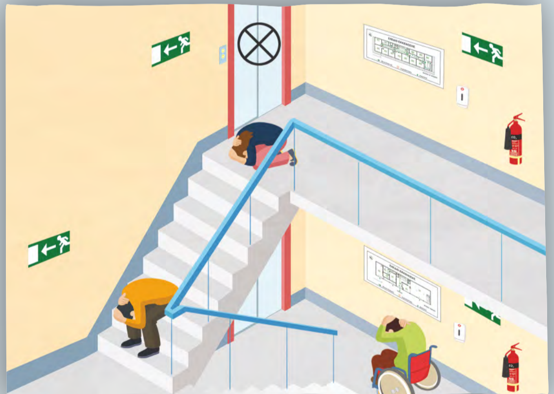
Αποφυγή μετακίνησης. Μείωση του ύψους και κάλυψη