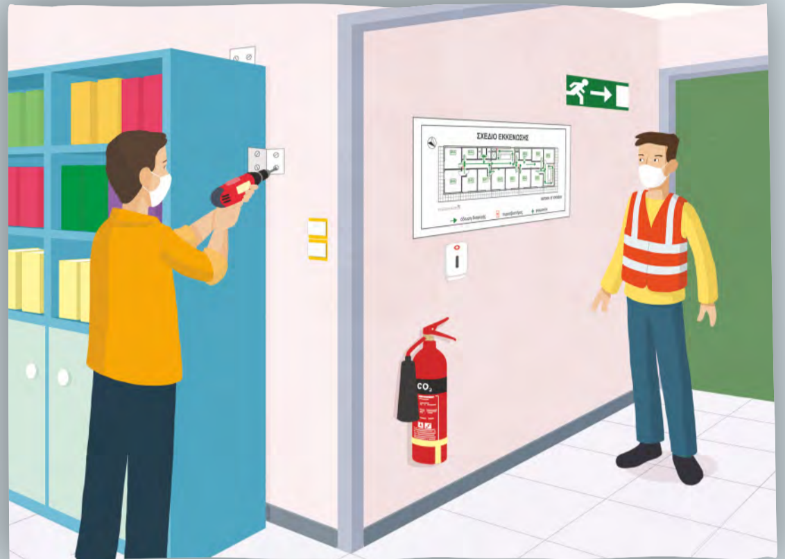
Επισήμανση και άρση επικινδυνότητας