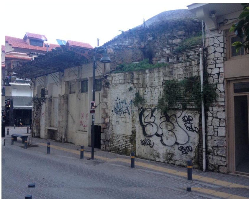
Το Τέμενος του Γαζή Ομέρ, όψη στην οδό Στρ. Ιωάννου

του τζαμιού φαίνεται πως υπήρχε προς την πλευρά της οδού Τσόγκα, η διάνοιξη της οποίας ίσως έγινε μετά την απελευθέρωση.